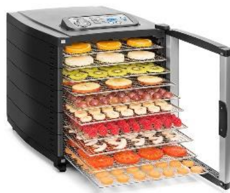
Ventilateur très silencieux