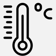
Températures réglables de 35 à 75°C avec préconisations en fonction des aliments