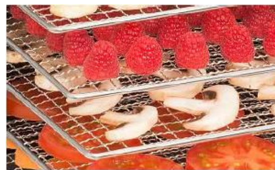
Possibilité de réaliser de nombreuses préparations simultanément