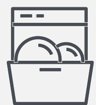
Plateaux et feuille de cuisson compatibles lave-vaisselle