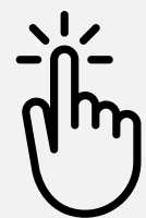
Panneau de commande intuitif