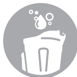
RESISTANT AU LAVE-VAISSELLE