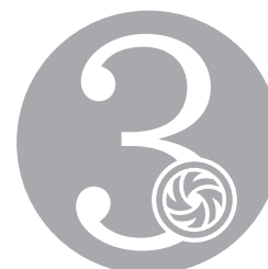
3 ANS DE GARANTIE