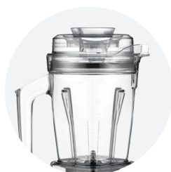
BOL 1.4 LITRES